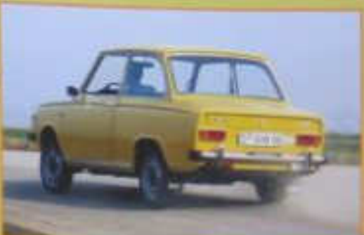
Die gelbe Beetle... (Caption partially cut off)