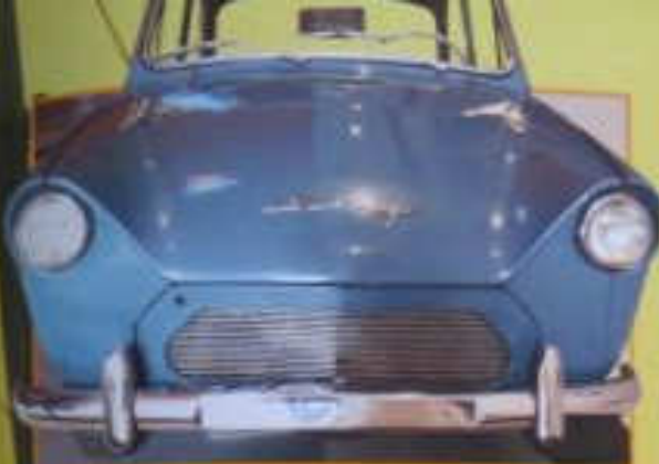
Die dunkelblaue Beetle... (Caption partially cut off)