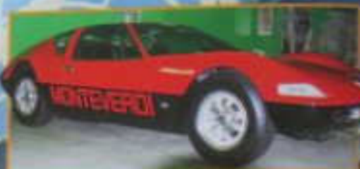
Das Bild zeigt ein rotes Sportwagenmodell der Marke Monteverde, das auf einer grünen Fläche abgebildet ist.

Die meisten Autos sind heute elektrisch angetrieben. Das ist ein großer Schritt vorwärts. Die meisten Autos sind heute elektrisch angetrieben. Das ist ein großer Schritt vorwärts. Die meisten Autos sind heute elektrisch angetrieben. Das ist ein großer Schritt vorwärts.