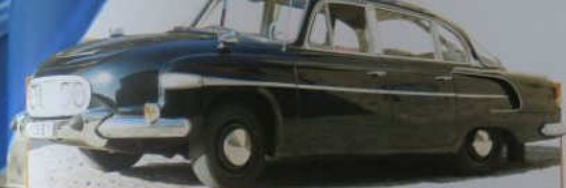
Das Bild zeigt ein dunkles klassisches Automobilmodell, das von der Seite abgebildet ist.