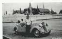
34. Škoda Popular byla populární i v Asii