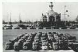
33. Vlozy Škoda (1935-1937) ve Španělsku