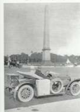
32. Voiturette MB na Place de la Concorde v Paříži rok 1911