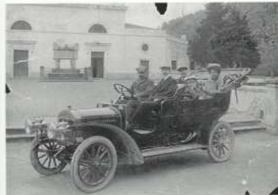
31. Voiturette Typ C se i první novými motory v Itálii 1909