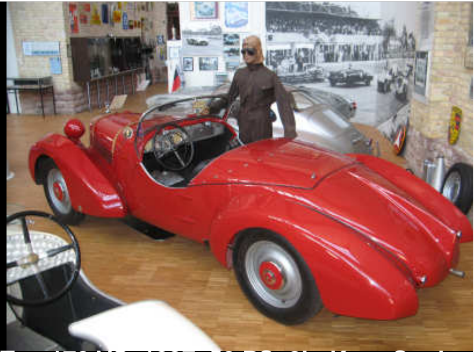
Typ 170 VS, 1937, 50 PS, 2L, Karr. Spohn