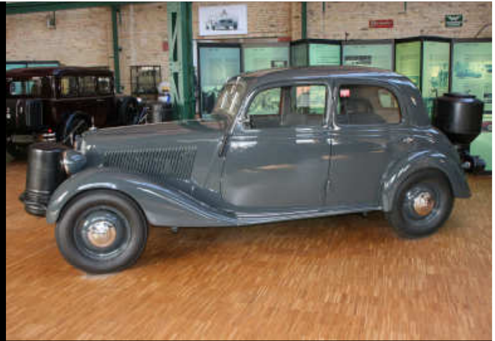
Sparmodell, 170 VGW, 1939-43 mit Holzvergaser, 22 PS und ein Heck-Merc.H, 1937