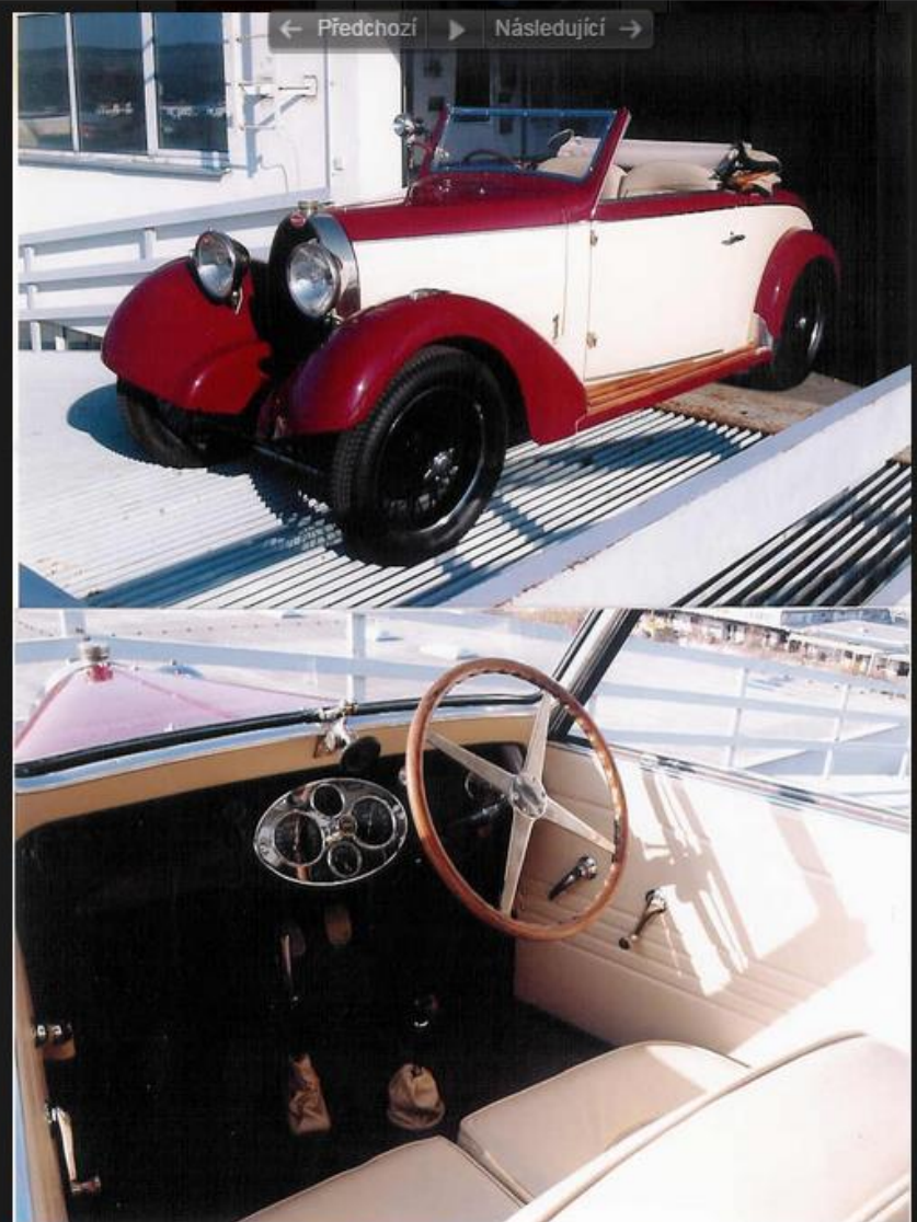
Bugatti 40 Ganglof - Ladislav Samohyl