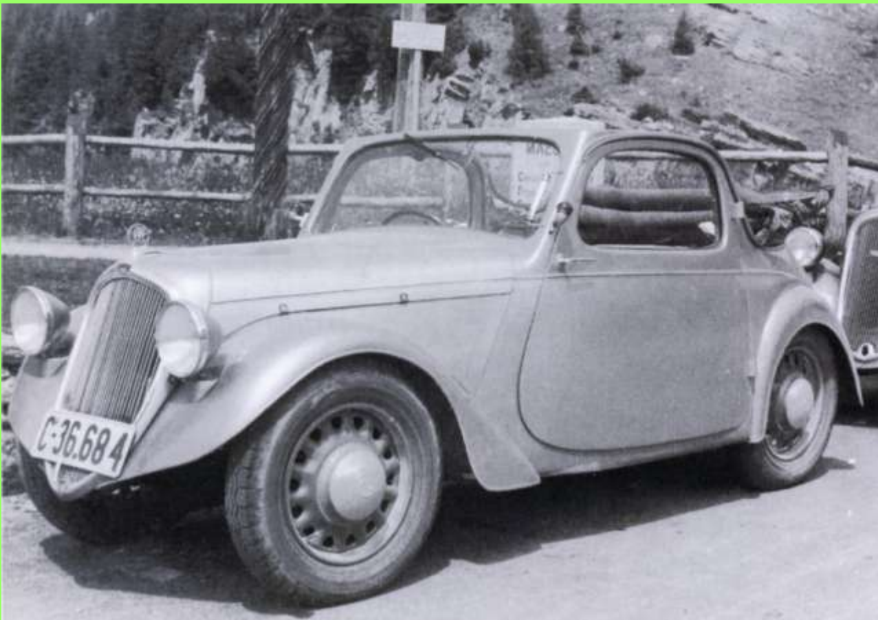
Eines der zwei Prototypen mit 2+2 Kabriokarosserie (weiter noch 4 Coupe und 1 Vierplatz-Tudor)