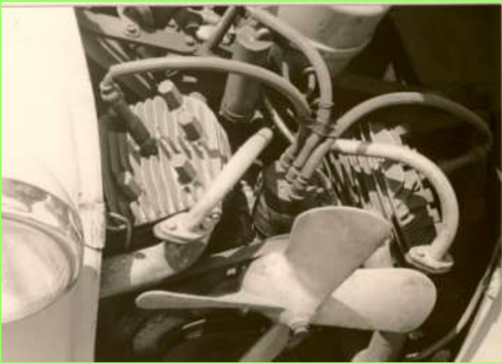
Spätere Version des Sagittamotors