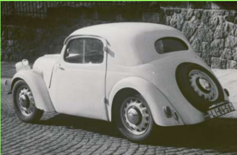
1965 Foto aus Liberec...