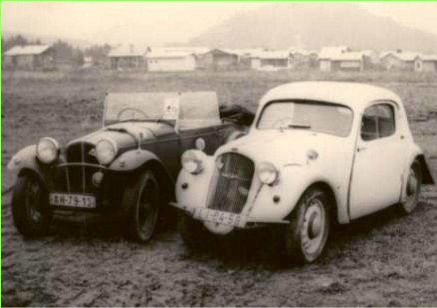
So klein war die Sagitta !!!