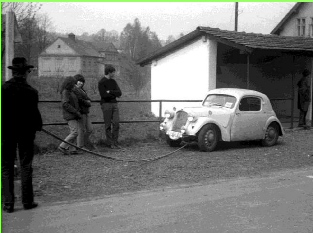
Sagitta hatte keine Radläufe und so verschmutzten die Motoraggregate desöffteren...und...