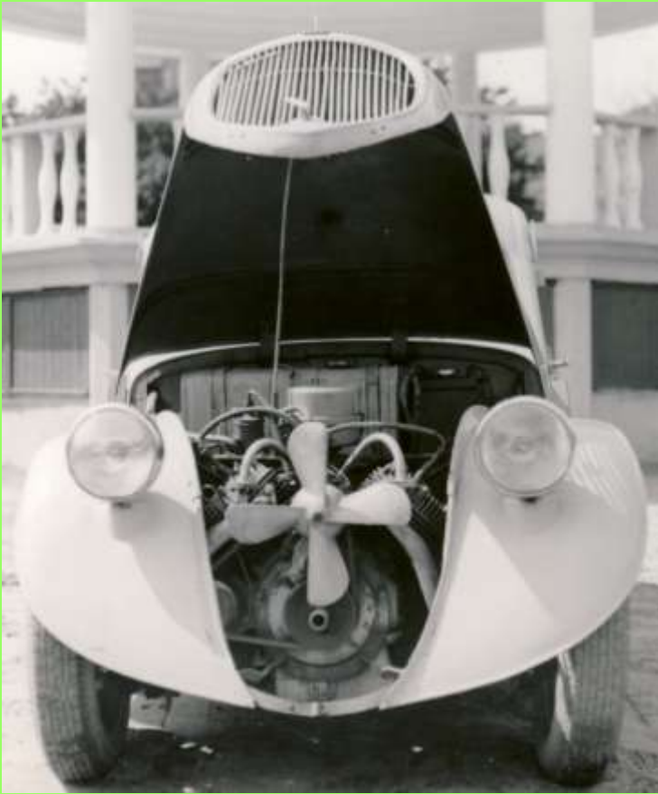
Hatte Sagitta eine Schiffschraube ? falsch: Ventilator ;-)