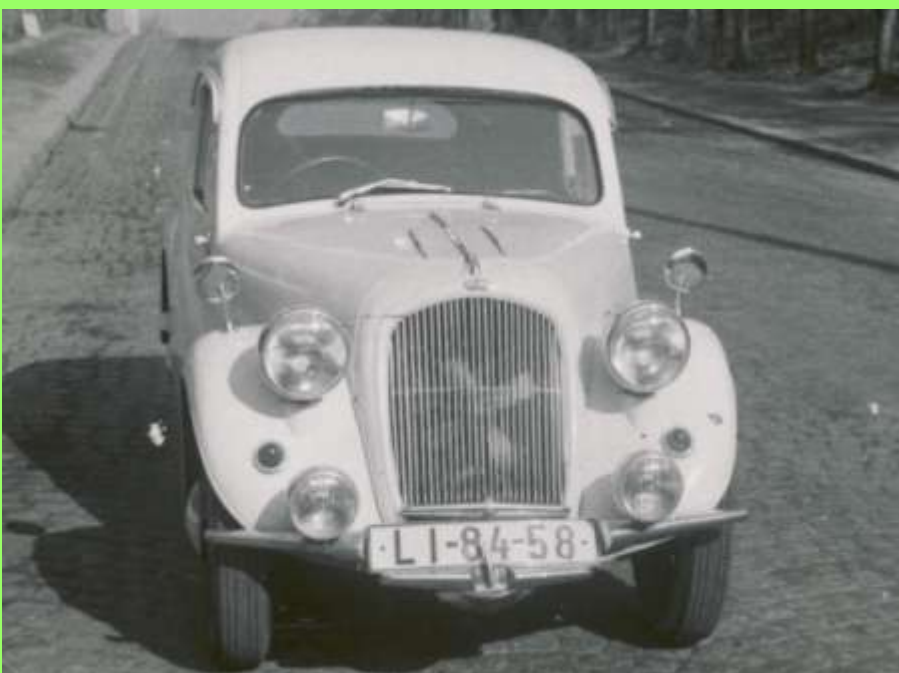
Verzierungen und Zusatzscheinwerfen wurden nachträglich vom Vorbesitzer montiert