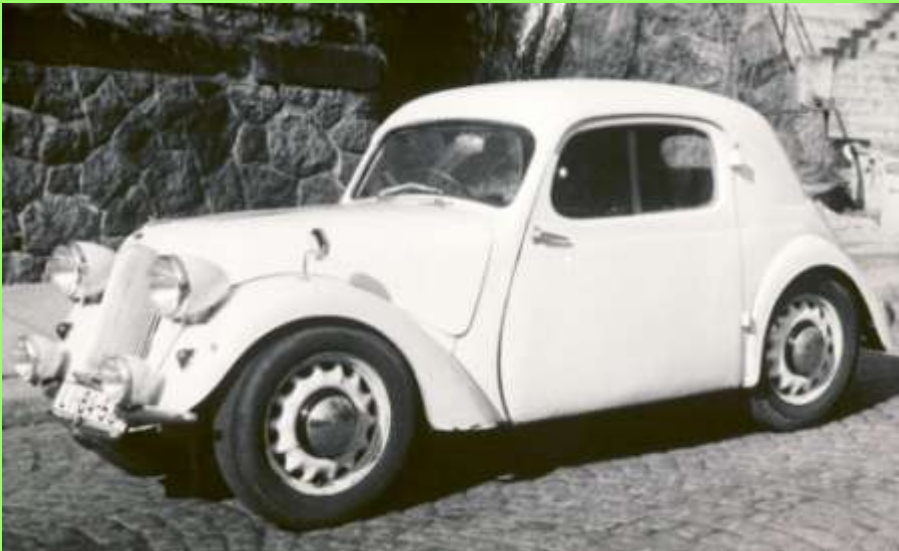
es fehlte der gefiederte Pfeil