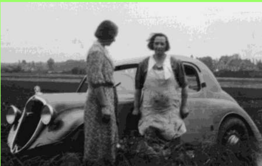
Seltene Variante ohne Kotflügel