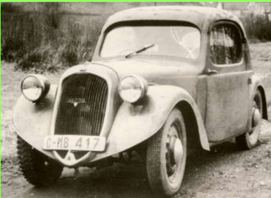
Pneu hin o.her- Hauptsache sie fuhr