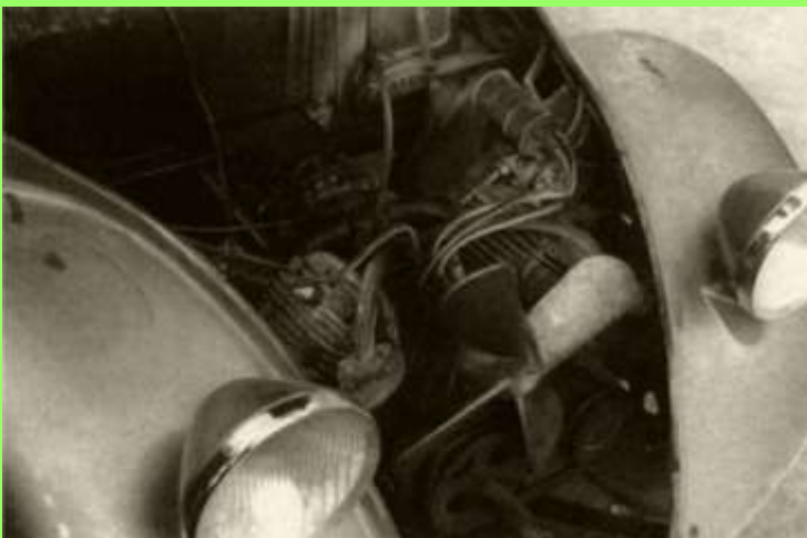
erster Prototyp: Scintillascheinwerfer, Zenithvergaser