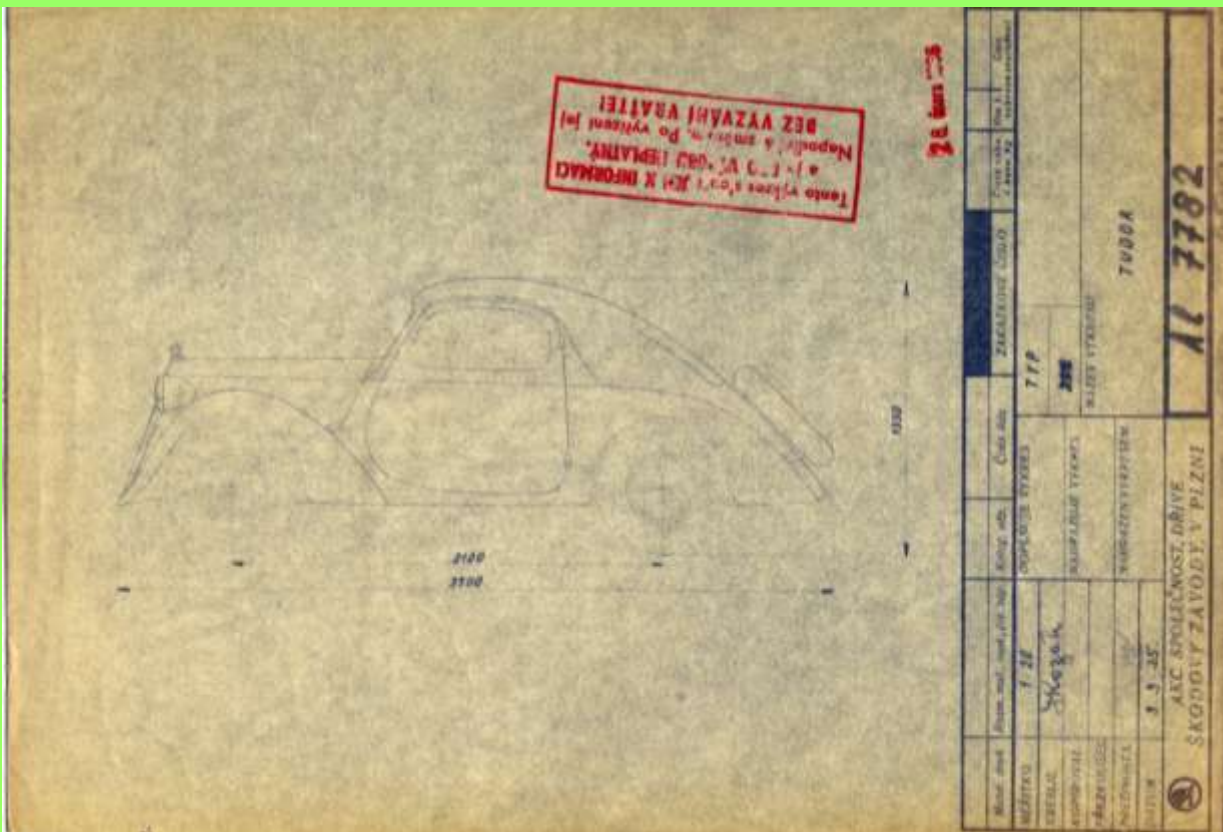
Werkzeichnung eines schnittigen und aerodynamischen Sagitta- Coupés, 1935